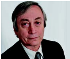
Helmut Schmidt : membre du Parti de Brandt et Ministre de son gouvernement. Il est aussi prétendant au trône de Willy. Ce qui lui donne une attitude envieuse et jalouse vis-à-vis de Brandt. Il est appelé «le Prince héritier » ou le «prétendant au trône de Willy ».