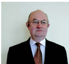
Hans-Dietrich Genscher : Ministre de l'intérieur pour le RFA et membre du FDP (Parti libéral démocrate), c'est un opposant.