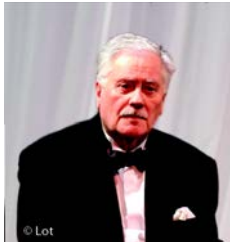
Herbert Wehner : chef du parti de Brandt (= le Parti social démocrate d'Allemagne/ SPD). Chargé du bon fonctionnement des coalitions. Parfois appelé « oncle Herbert » mais jamais en sa présence. Homme influent, les autres personnages parlent de lui comme d'un « marionnettiste » qui sait tirer les ficelles et qui est jaloux de ses marionnettes. L'une d'entre elles est Brandt. Ils le nomment aussi « l'ancien communiste ».